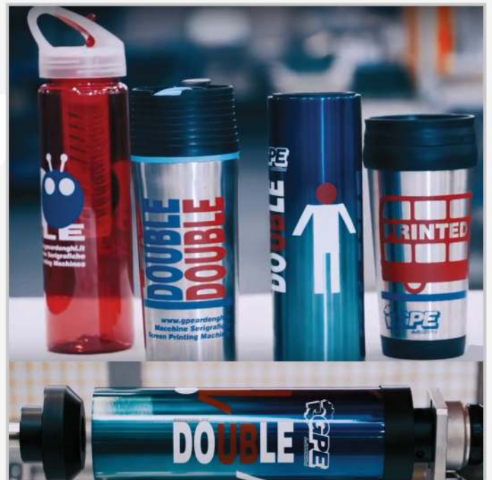
POSSIBILTA' DI STAMPARE UNO O DUE COLORI PER VOLTA POSSIBILITY TO PRINT ONE OR TWO COLOURS PER TIME