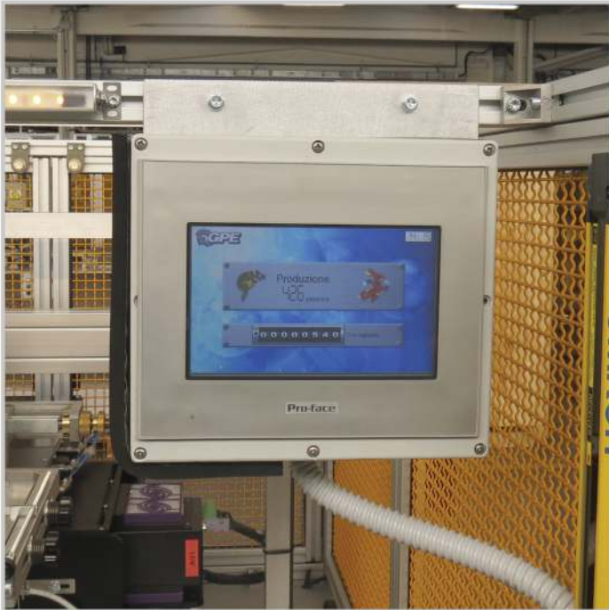
TOUCH SCREEN CON DISPLAY A COLORI TOUCH SCREEN WITH COLOR DISPLAY